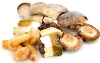
Baby & Boletus