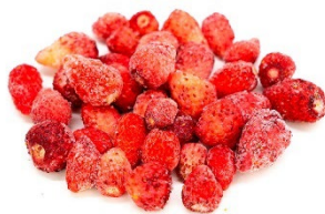
Fresilla del Bosque