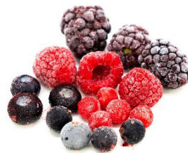
Mezcla de frutos rojos B