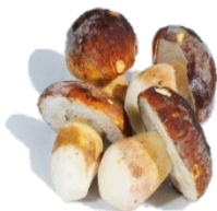
Boletus Entero P