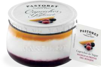
Mango & Fruites del Bosc