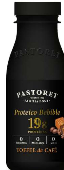
Toffee de Cafè