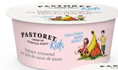
Maduixa & Plàtan