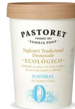
Ecològic Natural 0%