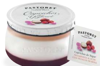
Gerds & Litxi amb Pètals de Rosa