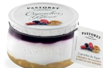
Galeta & Fruites del Bosc