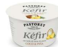
Coco & Pinya