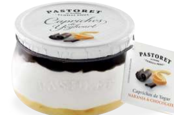
Taronja & Xocolata