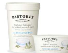
A l'Estil Grec