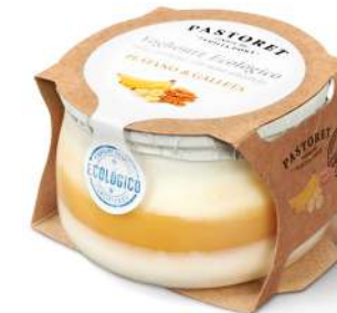
Plàtan & Galeta