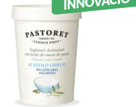
A l'Estil Grec sense sucre