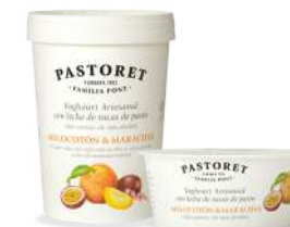
Préssec & Maracujà