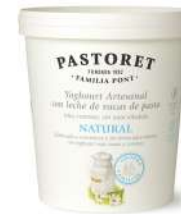
logurt Artesanal Natural 900g

Especialment ideats per als professionals de l'hostaleria, els grans formats de Pastoret permeten oferir als seus clients un producte d'alta qualitat, distintiu i d'elaboració artesanal, amb la textura i cremositat característiques de Pastoret. Aquestes presentacions són pràctiques i versàtils i, són una base ideal perquè cada professional aporti el seu toc creatiu, tant en l'elaboració de postres com en la preparació de receptes.