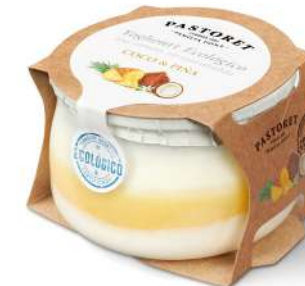
Coco & Pinya