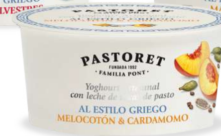
Prêsec & Cardamom