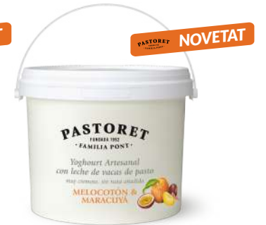
logurt Artesanal Préssec & Maracujà 2 Kg