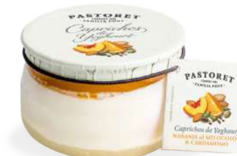
Taronja al Préssec & Cardamom