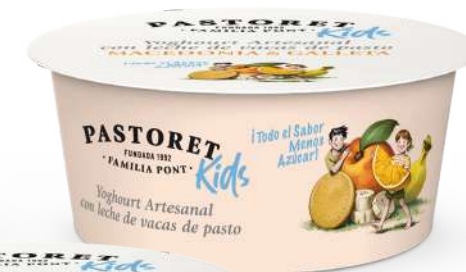
Macedònia & Galeta