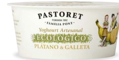
Plàtan & Galeta