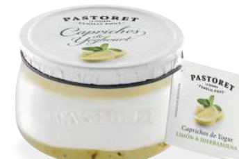
Llimona & Menta

El iogurt més premium amb combinacions irresistibles