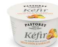
Préssec & Maracujà