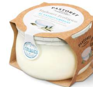
A l'Estil Grec