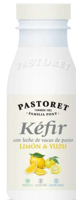
Llimona & luzu