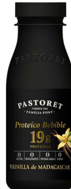
Vainilla de Madagascar