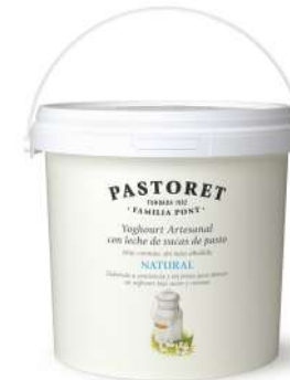
logurt Artesanal Natural 3,6 Kg