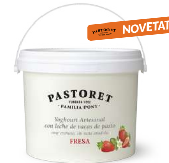
logurt Artesanal Maduixes 2 Kg