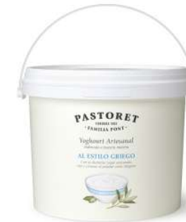
logurt Artesanal a l'Estil Grec 2Kg