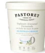
logurt Artesanal a l'Estil Grec sense sucre 0% 900g