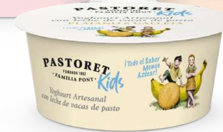
Plàtan & Galeta