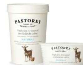
Natural amb Llet de Cabra