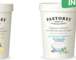
Limona & luzu