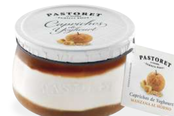
Poma al Forn