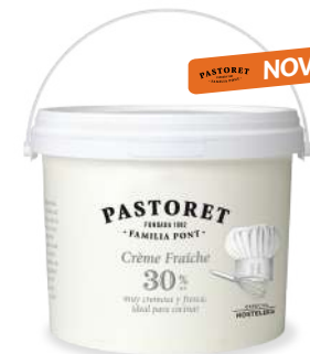
Crème Fraîche 2Kg